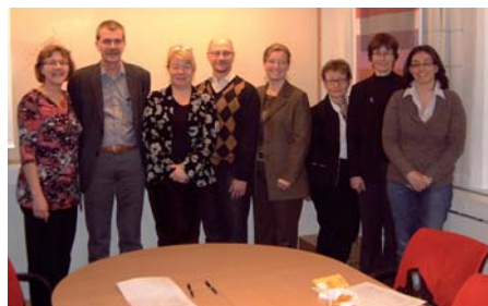
Representanter från de regionala EU-kontoren